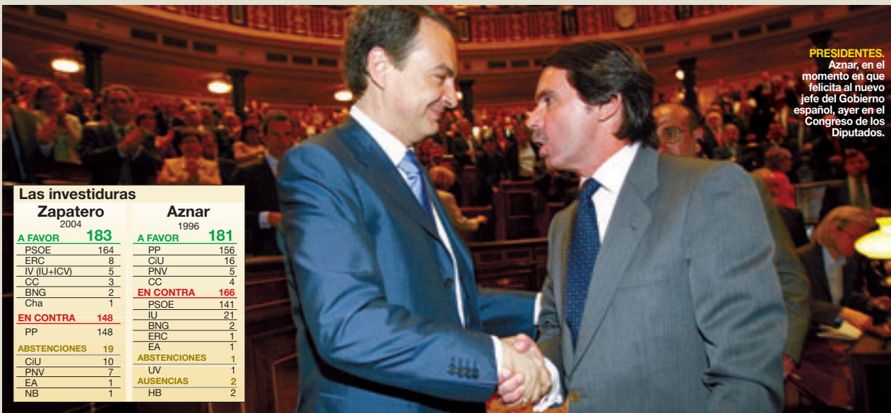
PRESIDENTES. Aznar, en el momento en que felicita al nuevo jefe del Gobierno español, ayer en el Congreso de los Diputados.